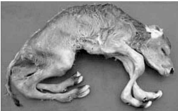
Aracnomelia ó Síndrome de la araña en bovinos "Spider legs"

4. Expresión de genes letales y semi - letales: Infortunadamente, el cruzamiento de individuos estrechamente emparentados puede incrementar la frecuencia de aparición de genes recesivos en condición homocigota (bb) situación frecuentemente fatal. Para el caso de genes semi - letales el individuo sobrevive hasta el momento del parto y puede ser totalmente improductivo.